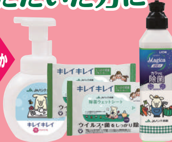
ライオン 「キレイキレイマジカセット」