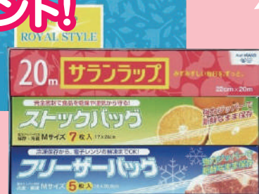
ロイヤルスタイルキッチンセット