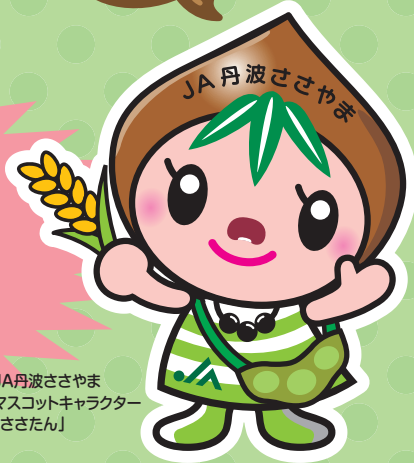
JA丹波ささやま マスコットキャラクター 「さたん」