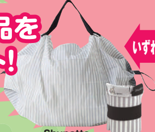
Shupatto 「コンパクトバッグ(S)」

※複数の年金のお振込につきましても、 お一人様につき1点となります。 ※商品の変更となる場合もございます。