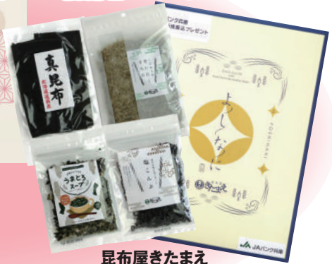
昆布屋きたまえ 「オリジナルギフトセット」