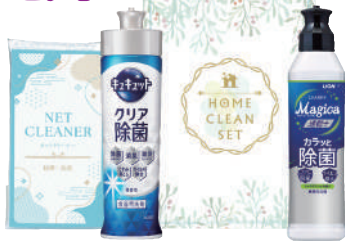
キッチンピカピカセット ※プレゼント商品は変更となる場合もございます。