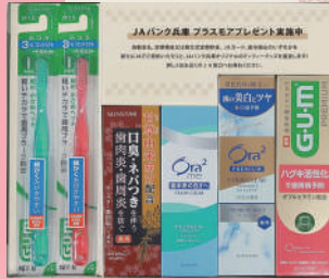
サンスター「ハミガキセット」