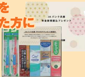
サンスター「ハミガキセット」