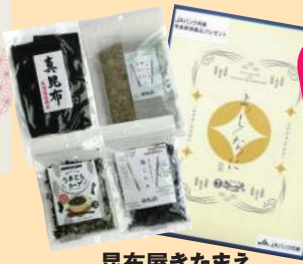
昆布屋きたまえ 「オリジナルギフトセット」

4月1日以降、 新たに年金振込された方に 3,000円相当 プレゼント! 専用紙(web)の応募で「QUOカード」 または、Amazonなどで使える「えらべる pay」をもらえなく!!