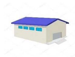
農業用倉庫の建築