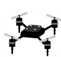
スマート農業の導入